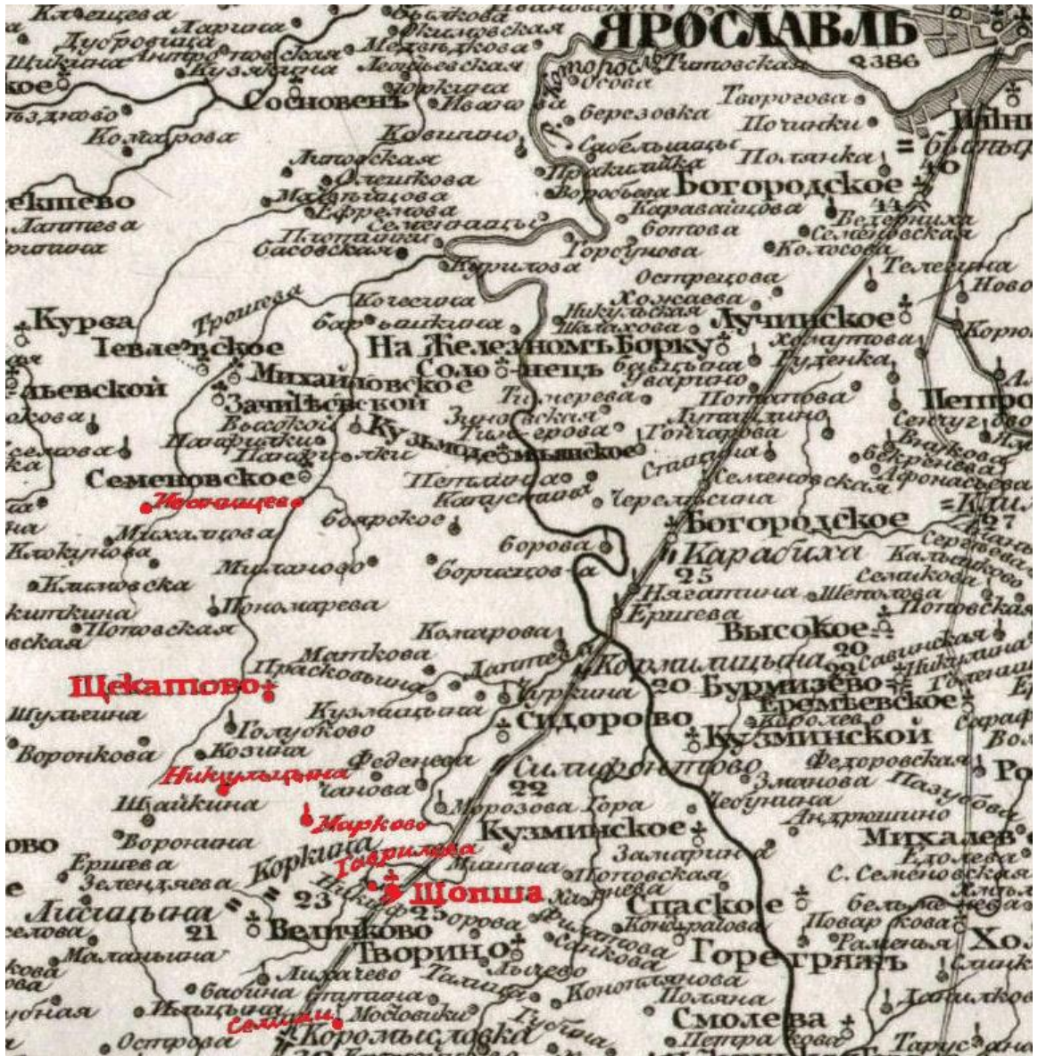
Фрагмент Спец. карты Г.Л. Шуберта Лист XX.

Выделено цветом Шопша, Гаврилково, Никульцино, Марково (ныне не существует, на его месте расположено садовое товарищество Железнодорожник-2), Щекотово, Иванишево, Селищи (ныне не существует).