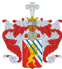
Герб рода Степановых

Родословная Степановых изложена в виде поколенной росписи, где первая цифра около имени означает порядковый номер описываемого лица, под которым оно указано в генеалогическом древе, а цифра в скобках – порядковый номер его отца.